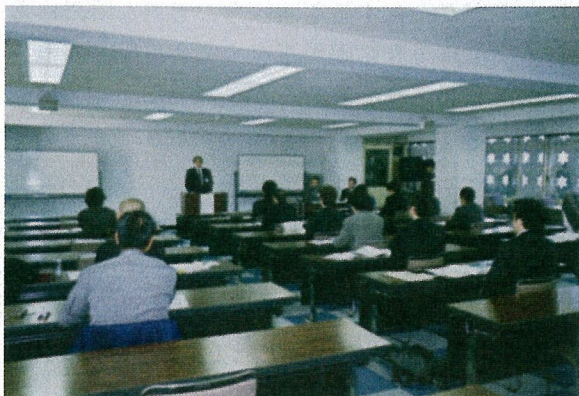
試験の様子(科学技術館にて)