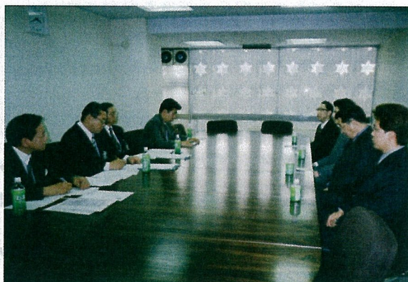
面接試験の様子(科学技術館にて)