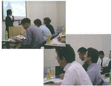
熱心を受講する参加者

今後とも弊協会としてはこのような形で、各企業に対して個別に同様のセミナーを実施していく予定です。また、これらのセミナーが日本企業及び団体における音声情報漏洩対策の一助となるべく、これからも活動を展開してまいります。