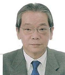
特定非営利活動法人 日本情報安全管理協会 専務理事・事務局長